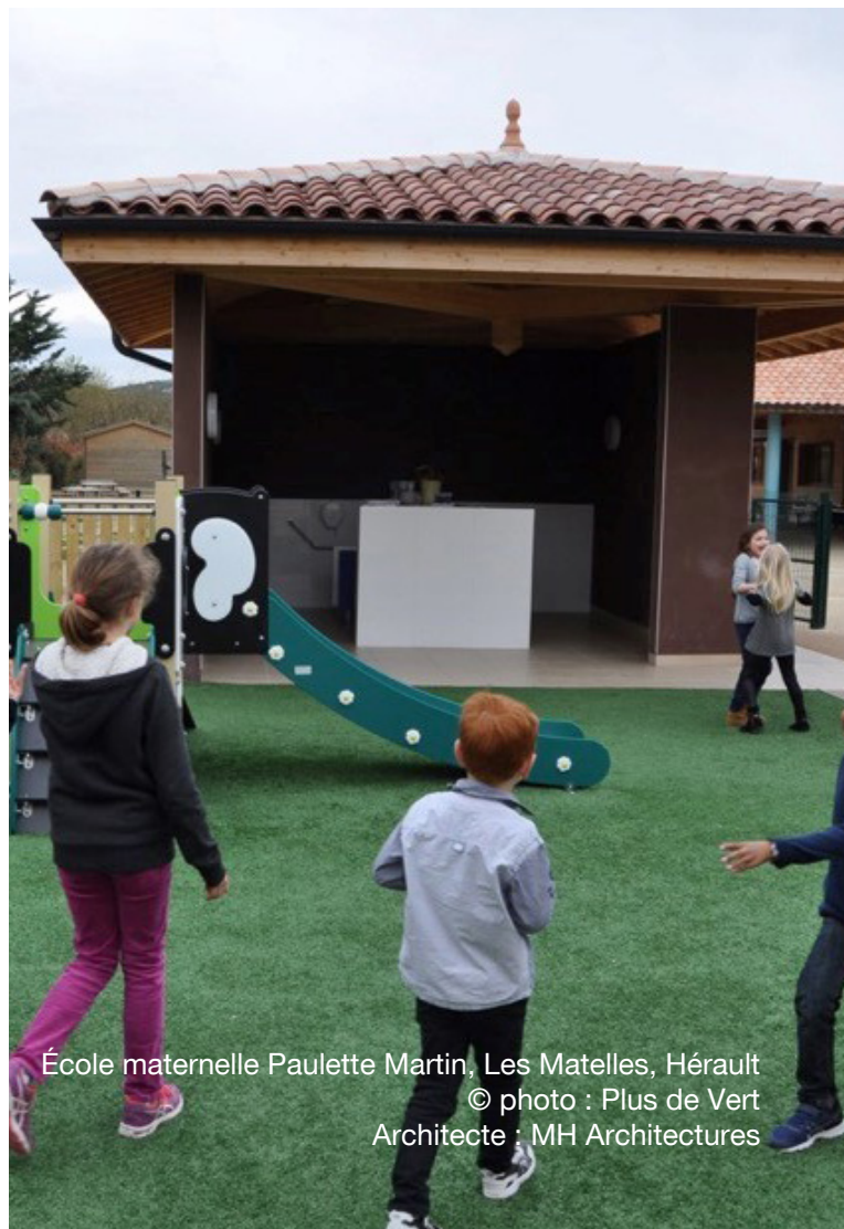
École maternelle Paulette Martin, Les Matelles, Hérault Architecte : MH Architectures

Climat : H3 /// Altitude : 60 m /// Surface : 796 m 2 /// Classement : BR1 - CE1 /// Planning travaux : Début : 01.2017 - Fin : 12.2017