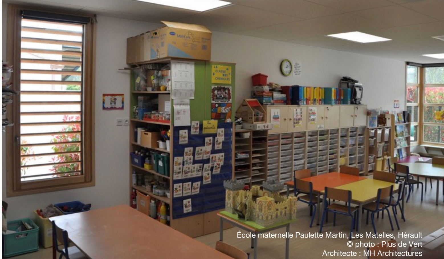
École maternelle Paulette Martin, Les Matelles, Hérault Architecte : MH Architectures