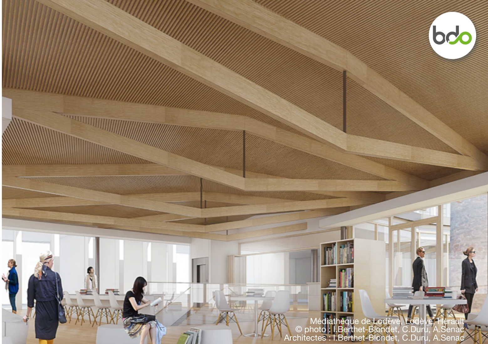
Médiathèque de Lodève, Lodève, Hérault Architectes : I.Berthet-Blondet, C.Duru, A.Senac