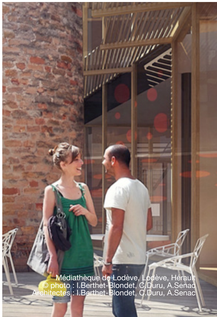
Médiathèque de Lodève, Lodève, Hérault © photo : I.Berthet-Blondet, C.Duru, A.Senac Architectes : I.Berthet-Blondet, C.Duru, A.Senac

Climat : H3 Altitude : 177 m Surface : 1078 m 2 Classement : BR1 - CE2 Planning travaux : Début : 09.2016 - Fin : 12.2017