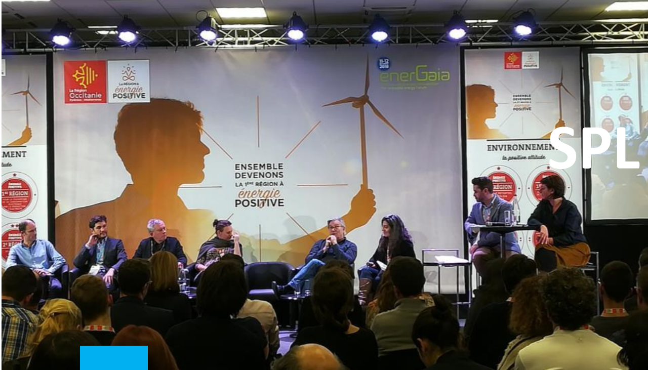
Assises régionales de l'énergie 2018