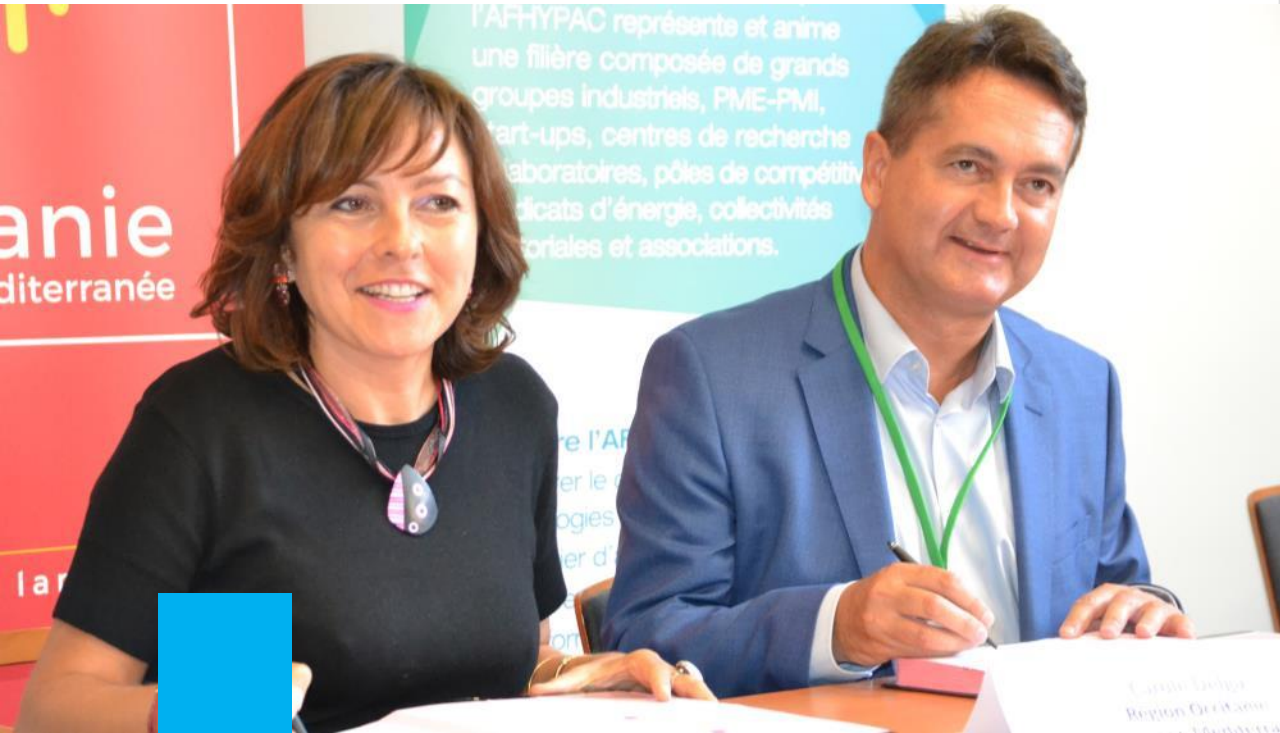
Signature de la convention Hyport