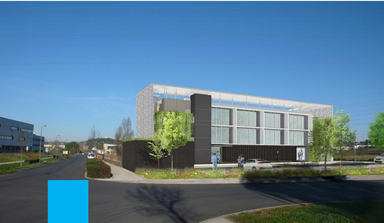
Immeuble INSPIRE (34)

Structuration d'un financement adapté aux engagements de performance énergétique portés par MIREIO