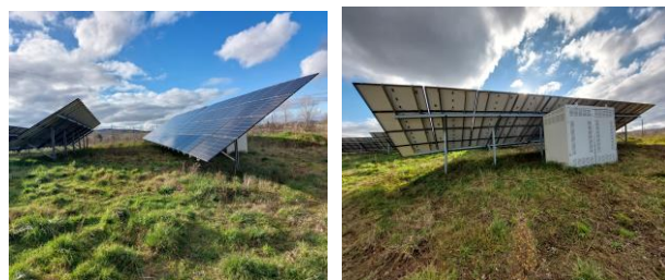
Equipements du site